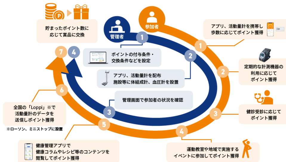
自治体や企業での「健康ポイント」プログラム利用イメージ